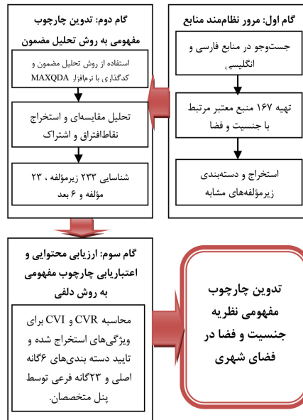
شکل ۳- نمودار فرآیند اجرا و دستاورد پژوهش

Charmaz, 2006). همچنین برای ارزیابی روایی ۳ یافته های کیفی از ملاک های تأمین اعتبار در پژوهش های کیفی شامل قابلیت اعتماد ۴ ، قابلیت انتقال ۵ و تعمیم پذیری ۶ ، قابلیت ارتباط ۷ و قابلیت تأیید ۸ استفاده شد. برای ارزیابی پایایی یافته های کیفی نیز از قاعده اشباع استفاده شد (ر.ک: خنیفر و مسلمی، ۱۳۹۹). پایه اصلی در پژوهش کیفی ابتدا لزوم تعهد پژوهشگر به دقت است و می توان مبنای کار آنها را در تعریف اولیه از اشباع نظری یعنی کامل شدن توصیف خصوصیات طبقات جست و جو کرد. نقطه اشباع نظری بیانگر پایایی ۹ روش تحقیق کیفی است، زیرا نقطه اشباع نظری به تکرار داده ها در تحقیق می پردازد و این تکرار داده ها و نتایج حاصله از آن، در روش شناسی، بیانگر پایایی روش تحقیق است (ر.ک: دانایی فرد و دیگران، ۱۳۹۸). فرآیند اجرای مقاله حاضر در شکل (۳) نشان داده شده است.