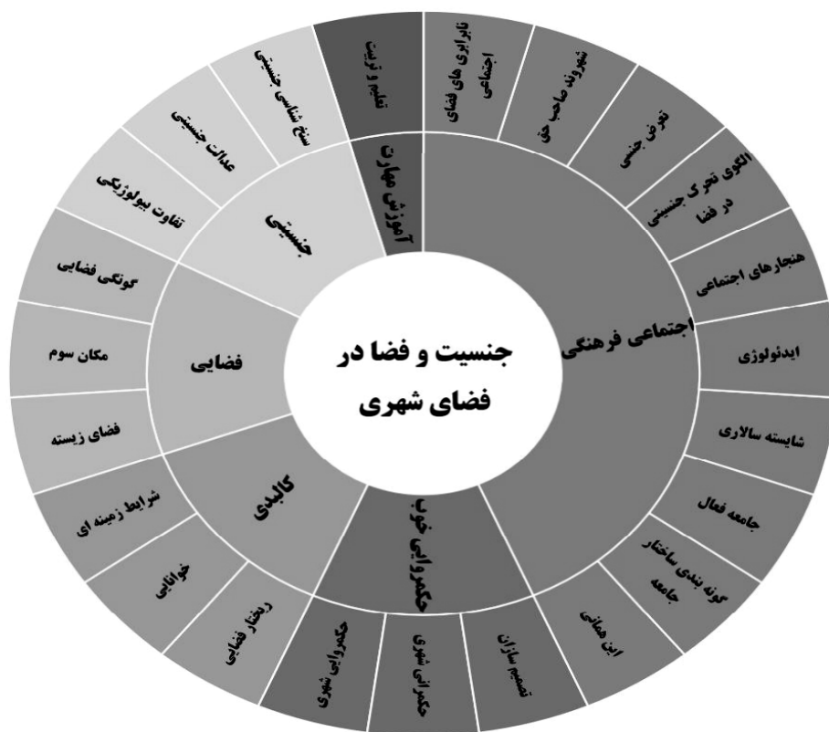
شکل ۴- چارچوب مفهومی نظریه جنسیت و فضا در فضای شهری

فرهنگی» بوده است. در مقابل، بعد «آموزش و مهارت» و امکان افزایش فعالیت در این حوزه از دید پژوهشگران مغفول مانده و کمتر به آن پرداخته شده است.